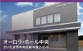
オーロラ・ホール中央 さいたま市中央区新中里2-2-9