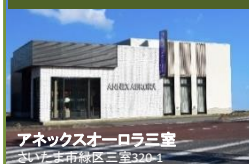
アネックスオーロラ三室 さいたま市緑区三室320-1