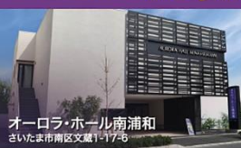
オーロラ・ホール南浦和 さいたま市南区文蔵1-17-6