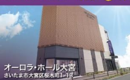
オーロラ・ホール大宮 さいたま市大宮区桜木町1-1-2