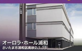
オーロラ・ホール浦和 さいたま市浦和区高砂2-2-15